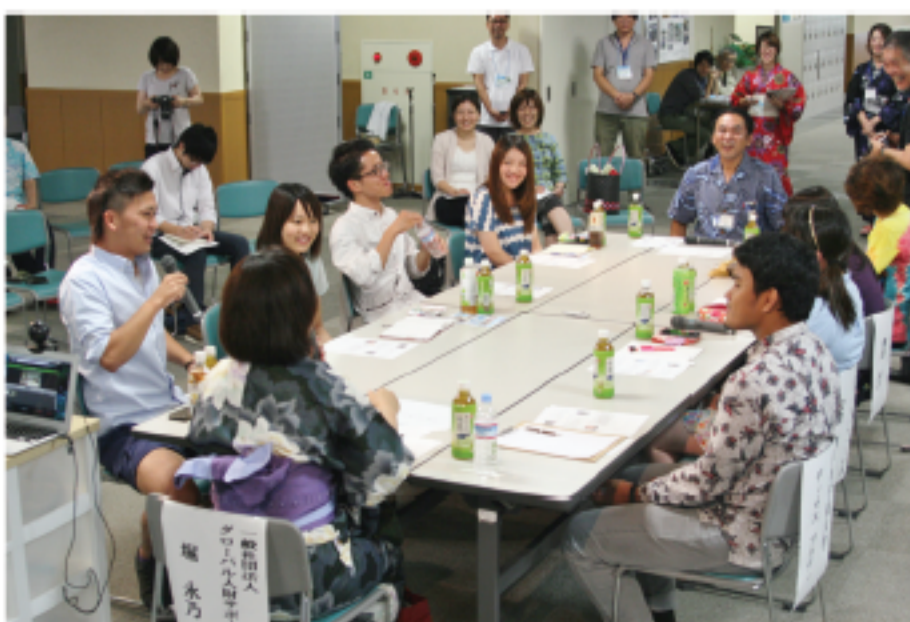
時に激しく、時に和やかに討論会は進んだ。

『もっと自分たちの活動を知ってサポートして欲しい。活動が広がることによって大学の知名度に貢献できるのなら、学生のことを使ってくれて構わない。』と、大学との関わりについて率直な意見を述べました。