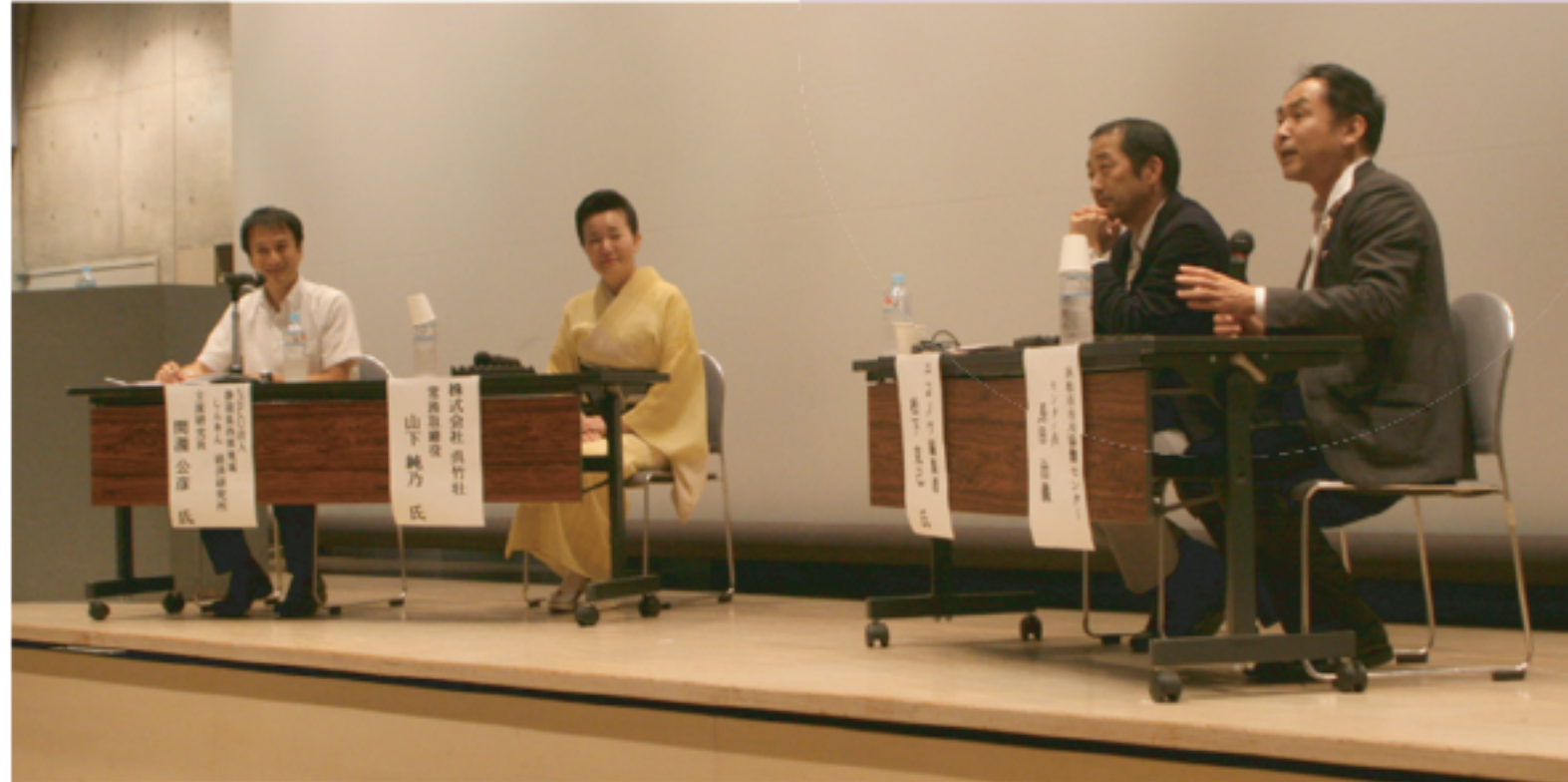
株式会社呉竹荘、情報誌エコノワ編集室、浜松市市民協働センターの各代表者によるパネルディスカッションが行われた。

このような意識を持った企業活動は人づくりにつながり、ひいては地域社会を変えるチカラとして生きてくるのではないのでしょうか。