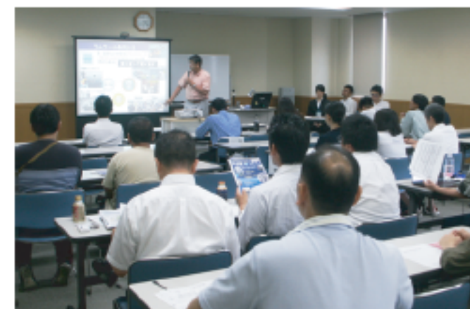
市民団体、企業など、会場は多くの聴講者でにぎわった